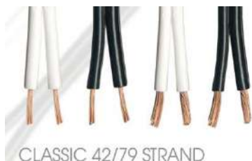
CLASSIC 42/79 STRAND